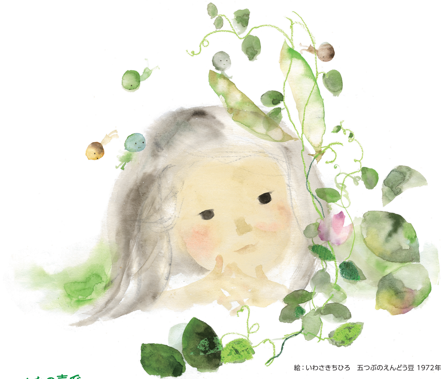
絵：いわさきちひろ 五つぶのえんどう豆 1972年