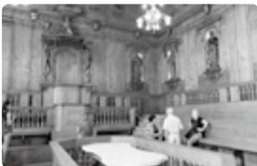
ポーニャ大学の解剖学教室にて