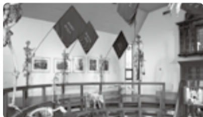
ライデンのブルハーフェ博物館解剖劇場の模型