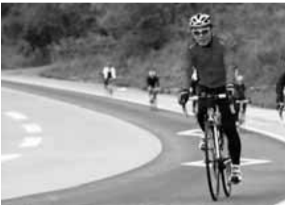
「ロードバイクの性能は、値段ではなく、乗る者の心臓の強さで決まる」 ロングライドイベント「グランフォンド八ヶ岳2011」にて

まだ夜が明けきらぬ中、一台の自転車が町田の住宅地を飛び出す。細いタイヤに多重ギア、軽量化の進んだフレーム。速く、長く走るために計算し尽されたロードバイクに跨って、多摩川までの往復30km、ライドを楽しむ。休日ともなるとヤビツ峠での100km走行、平時も県内の移動手段は基本コレだ。