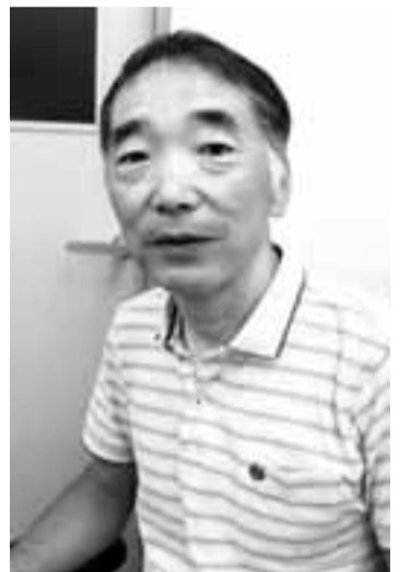
横浜市生まれ。横浜翠嵐高校出身。1981年横浜市立大学医学部卒業。県立足柄上病院、横浜市立市民病院等での勤務を経て、1990年「しみず整形外科」を開院。