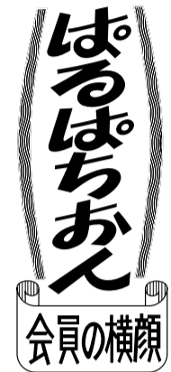
「ぼるぼちおん」(ドイツ語で「触診」の意)は、会員の趣味に迫るコーナーです。